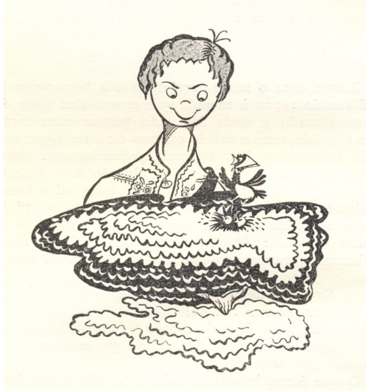
Figura 1 – Ilustração de Mário Dias

O Russo é apresentado como um menino perverso que faz maldades com diversos animais indefesos, tendo como diversão passar as tardes em busca dos pobres bichos para maltratá-los.