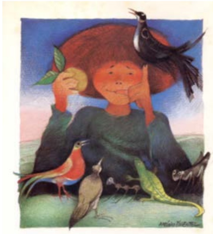
Figura 2 – Ilustração de Antônio Pimentel